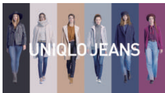
UNIQLO JEANS グローバルPV