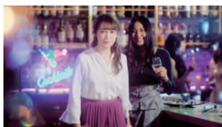
花王 Primavista「夜遊びプリマ」